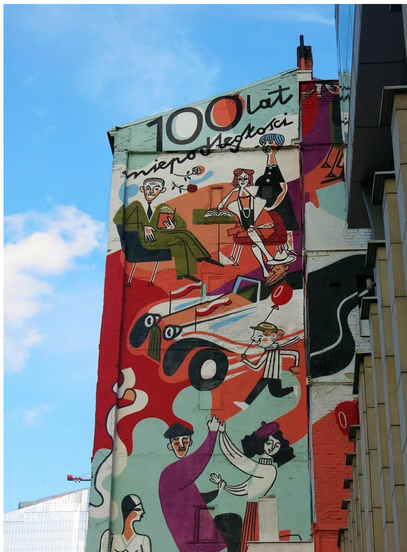
Mural , autorka: Katarzyna Bogucka, ul. Prosta, Warszawa, 2018

Główną ideą stworzenia muralu z okazji 100 lat niepodległości było pokazanie radosnej i kolorowej sceny z życia artystycznej bohemy. Miał nieco odejść od historycznego i patriotycznego klimatu innych murali powstałych z okazji tej rocznicy.