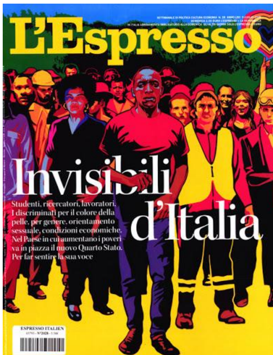
Copertina dell'Espresso, 2 luglio 2020