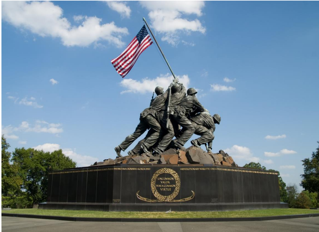
The United States Marine Corps War Memorial (Iwo Jima Memorial)

The USMC War Memorial is a national memorial located in Arlington County, Virginia, in the United States. It was dedicated in 1954 to all Marines who have given their lives in defense of the United States since 1775. It was inspired by the iconic 1945 photograph of six Marines raising a U.S. flag atop Mount Suribachi during the Battle of the Island of Iwo Jima in World War II taken by Associated Press combat photographer Joe Rosenthal.