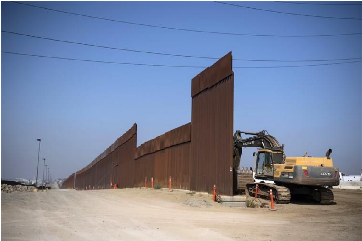
Construction is seen on the secondary fence that separates the United States and Mexico in the San Diego Sector on Aug. 22, 2019 in San Diego, Calif.