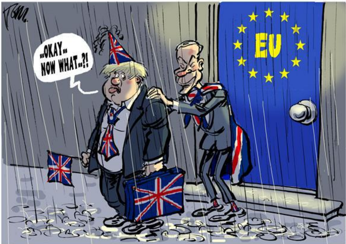
“Brexit Finally”, cartoon by Tom Janssen, January 31st, 2020