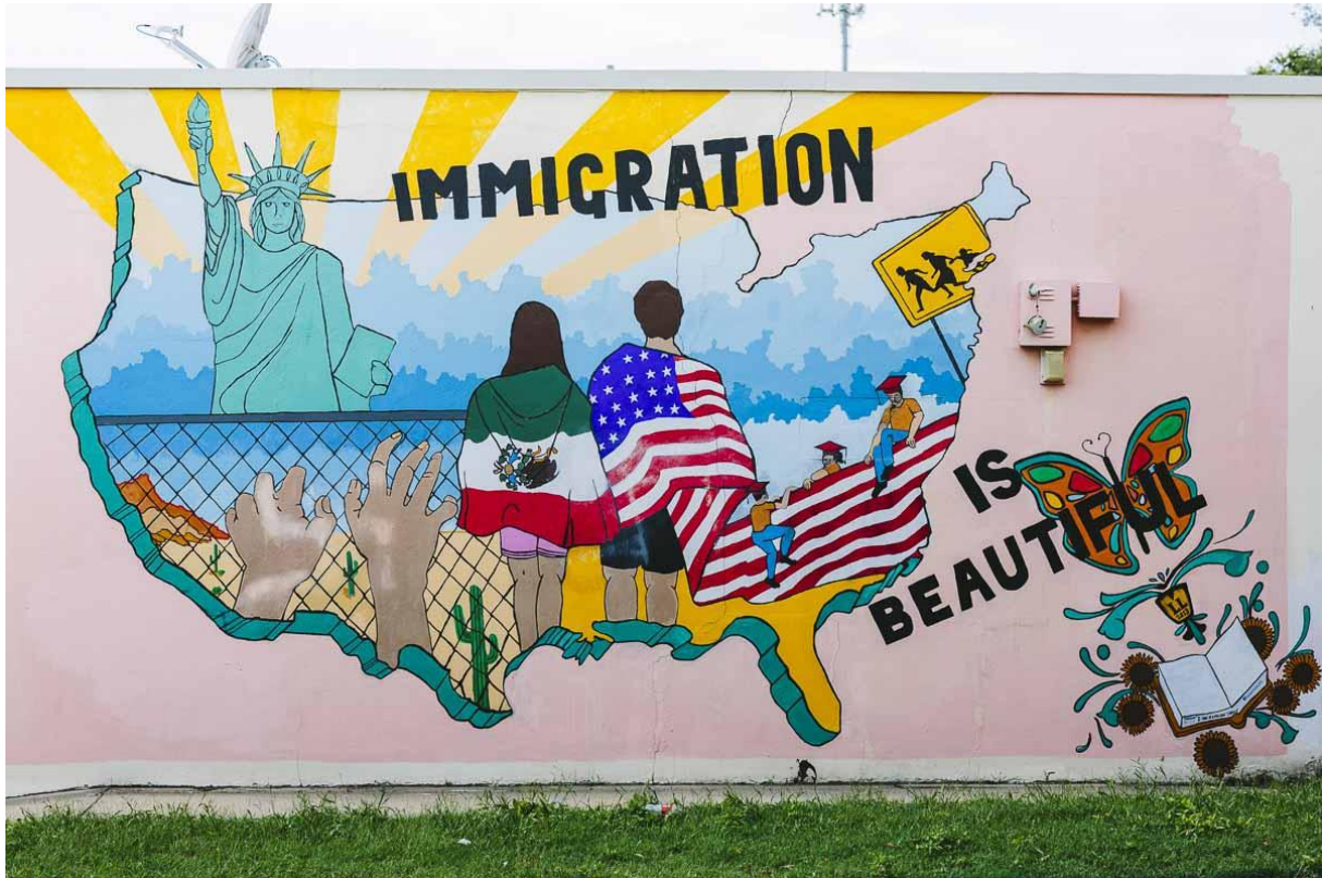
Mural painting in North Wichita, Kansas, USA, 2013