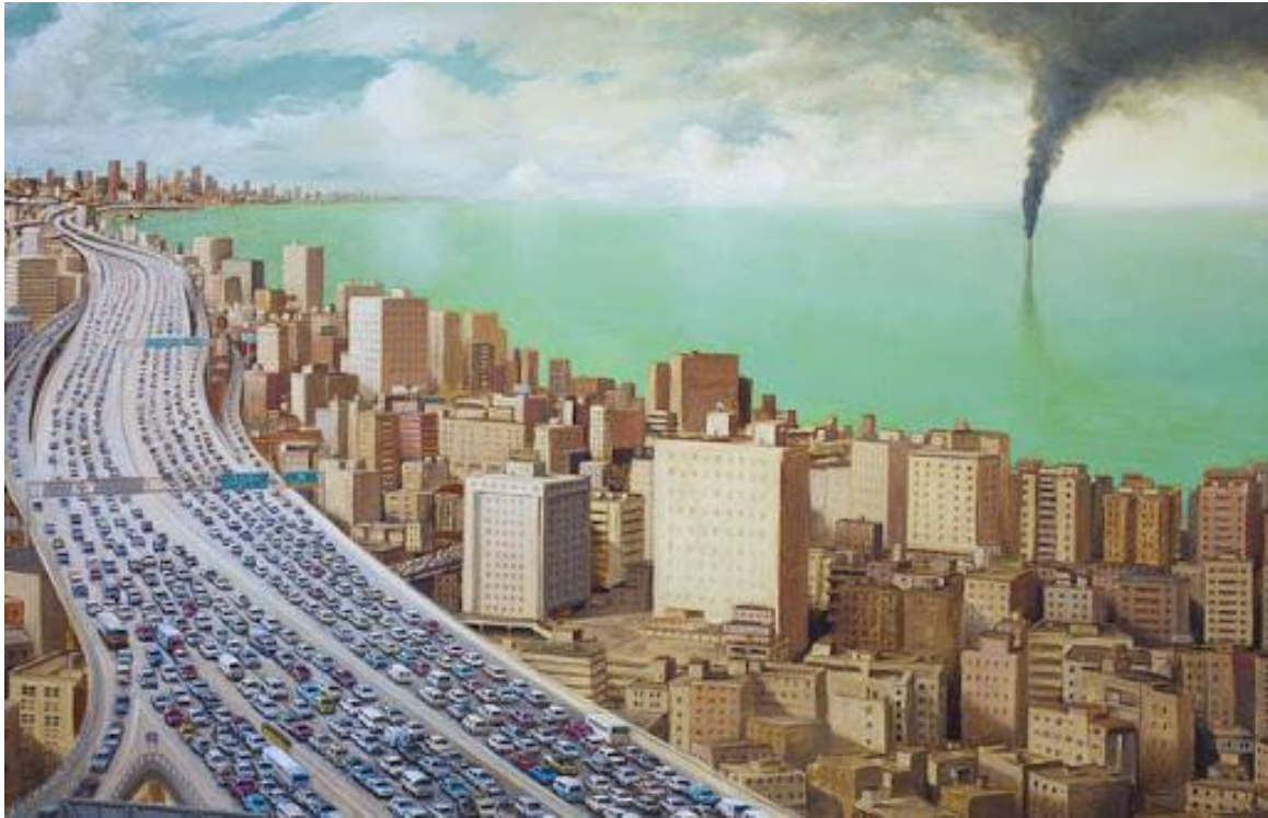
A Means to an End , Michael Kerbow, 2011

Oil on canvas, 48 x 60 inches (122 cm x 152 cm)