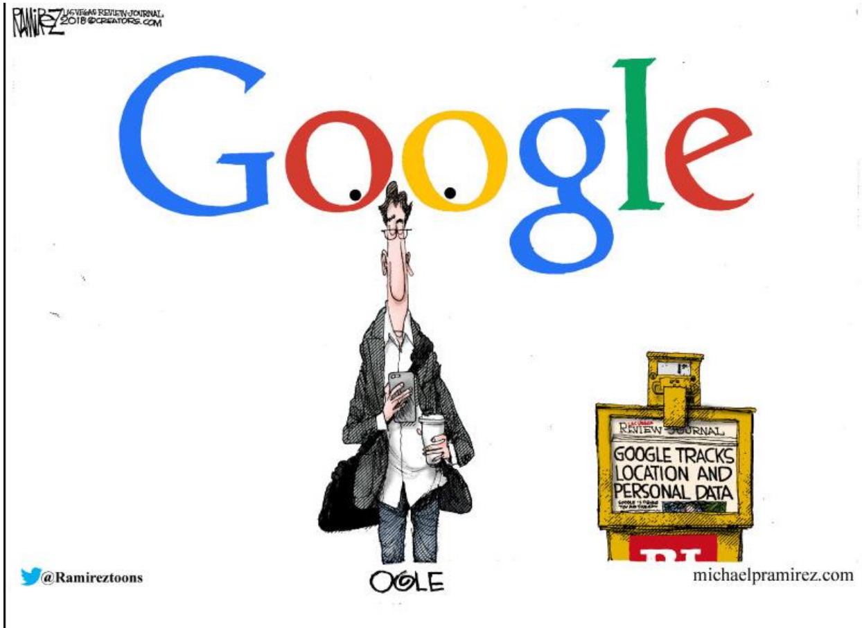
“The Privacy Issue”, cartoon by Michael P. Ramirez

Las Vegas Review-Journal – December 17, 2018