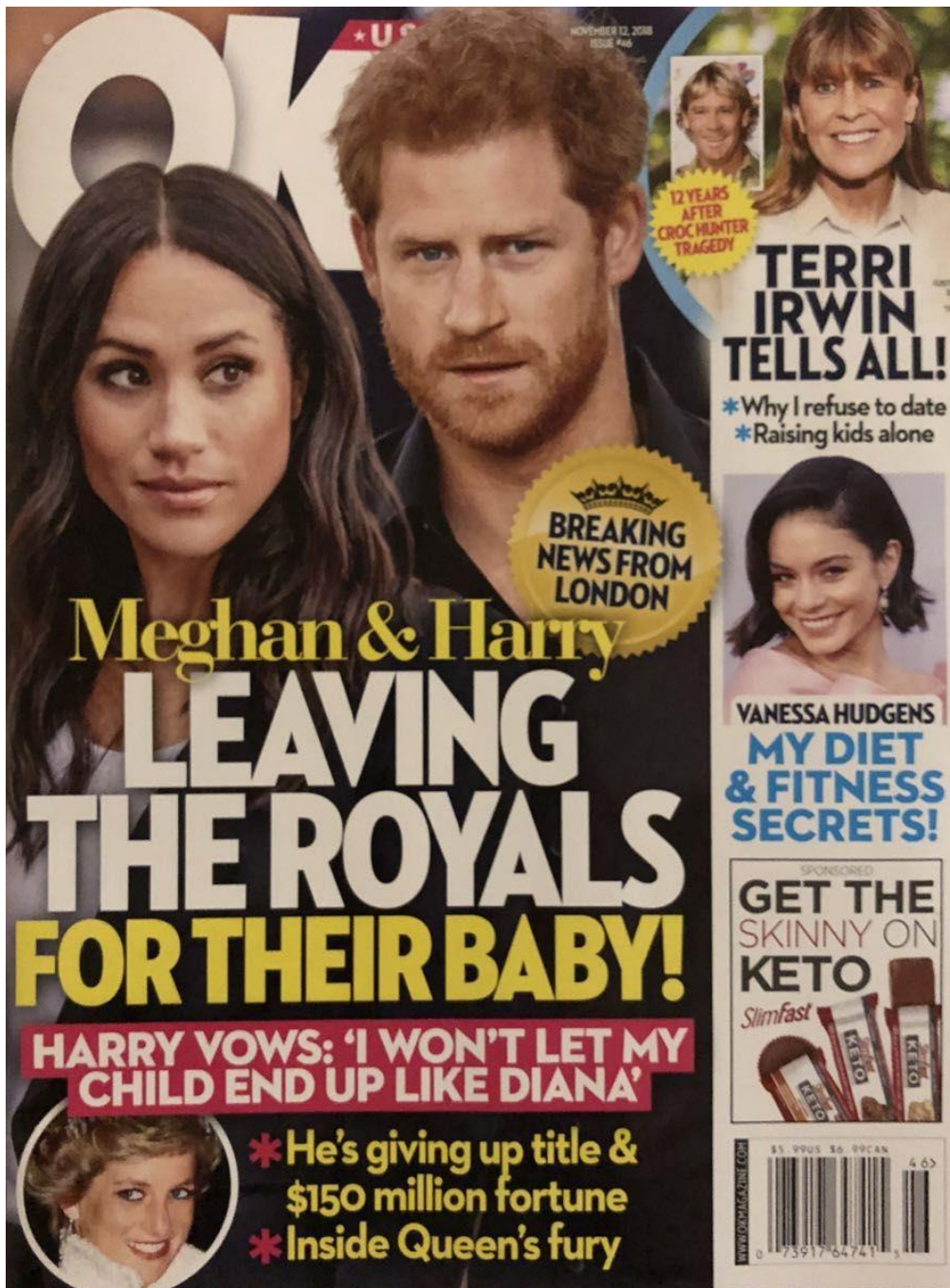
Front page of OK! (USA), November 12, 2018