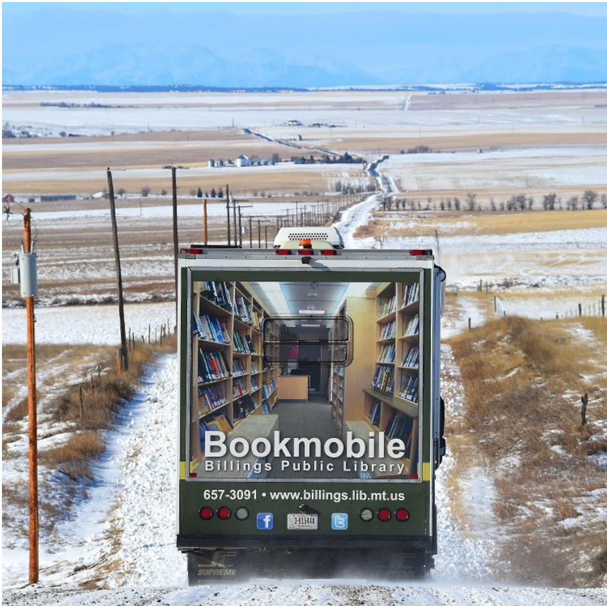
“Bookmobile”, Billings Public Library’s mobile library truck, on the road in Montana, USA