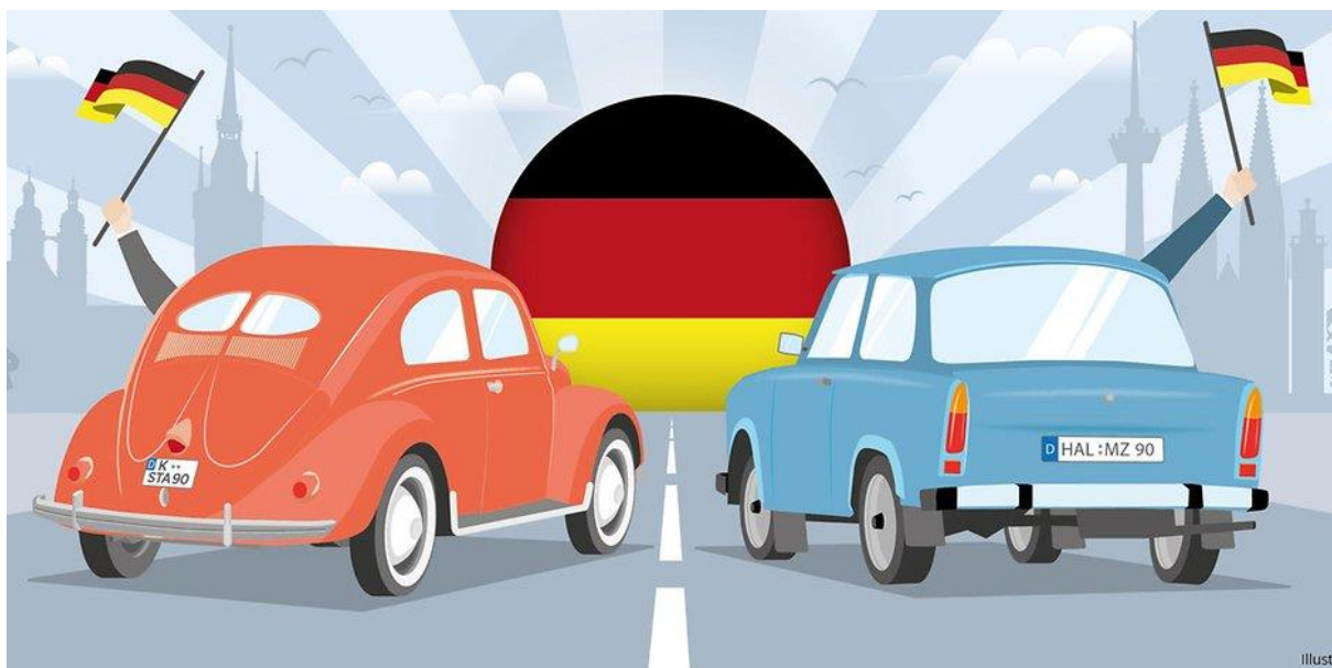
Abbildung: Ein VW-Käfer und ein Trabant: die Symbole der zwei Welten (Grafik KStA)