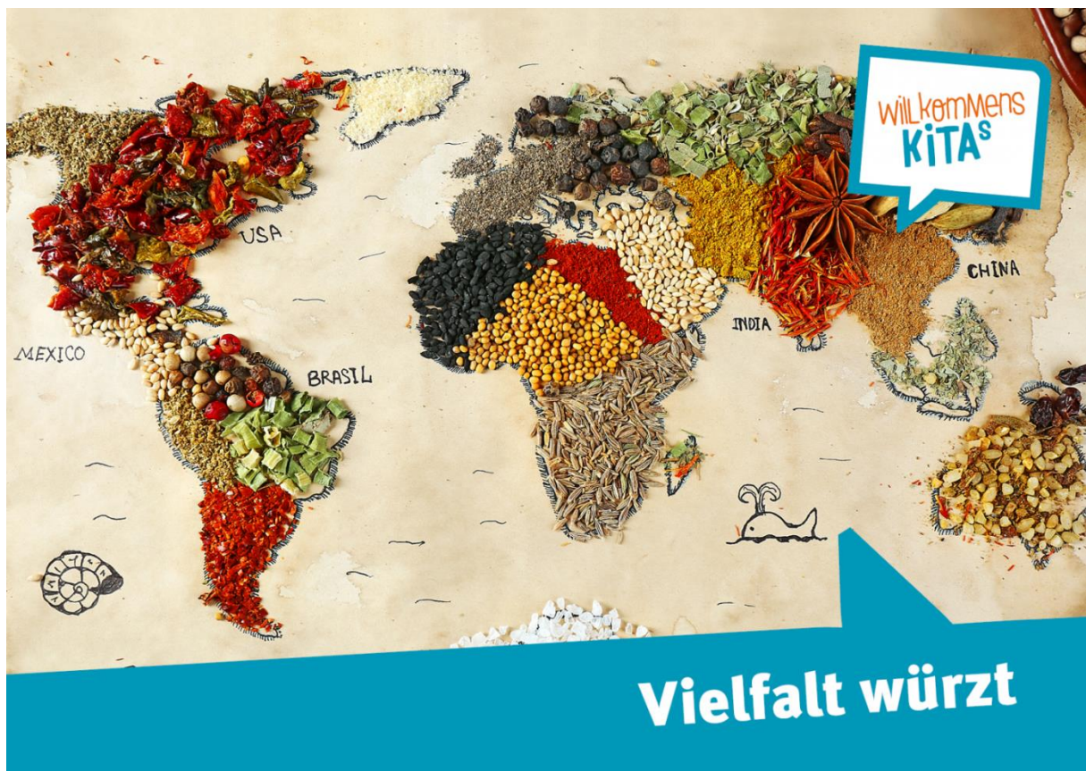
Plakat – Vielfalt würzt – Vielfalt hat viele Gesichter Willkommenskitas*, 2015