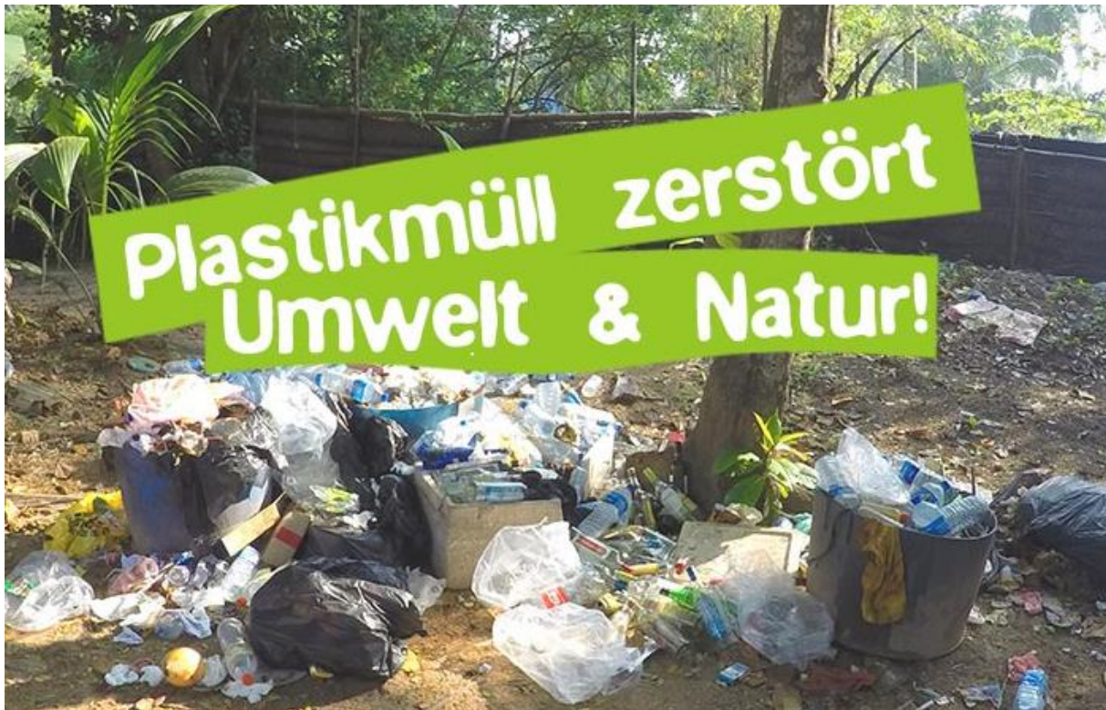
Foto aus der Webseite des Umweltschutzprojektes Careelite: „Plastikmüll zerstört Umwelt und Natur“