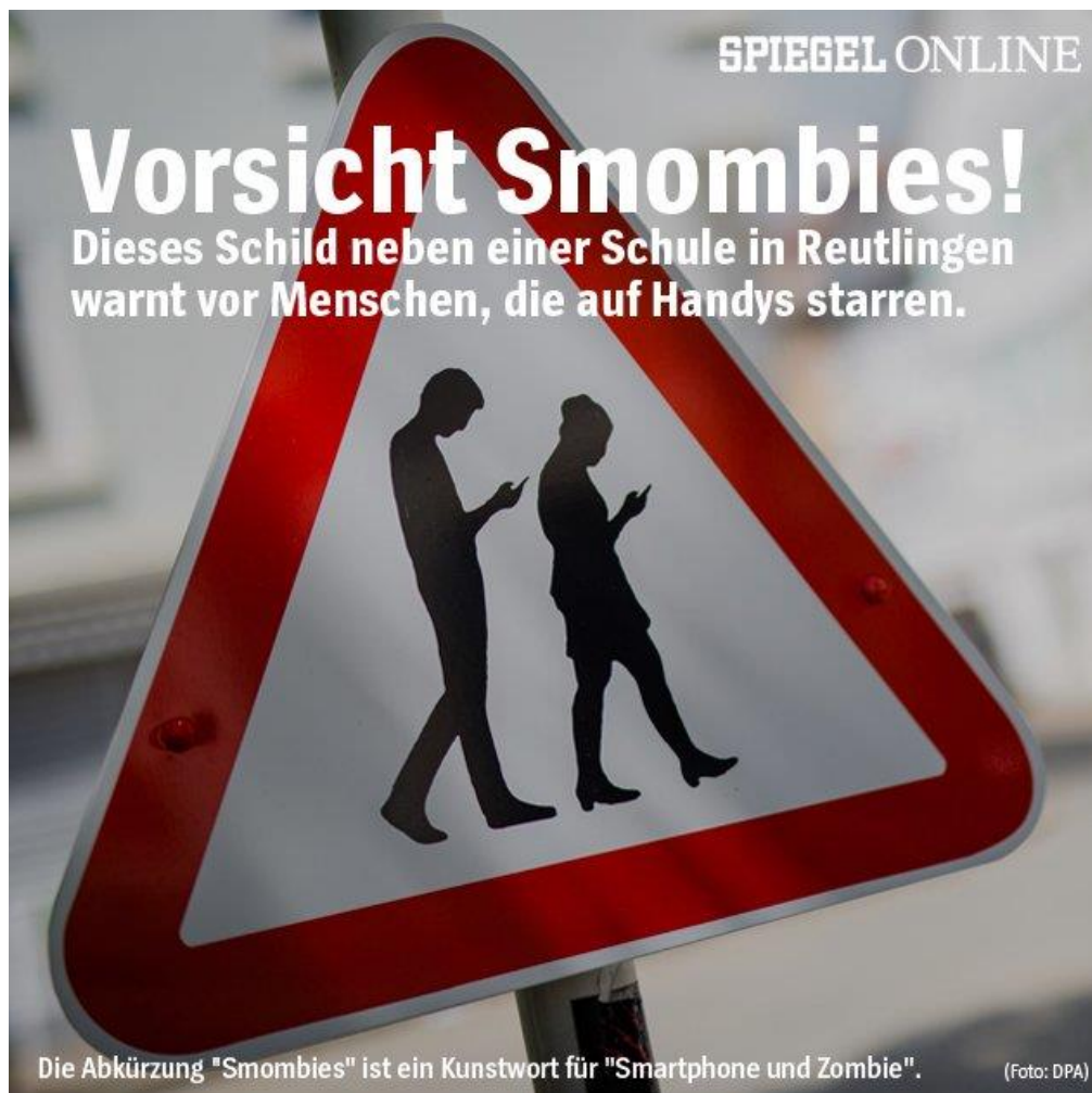
Titelseite - Spiegel online, 26/04/2018