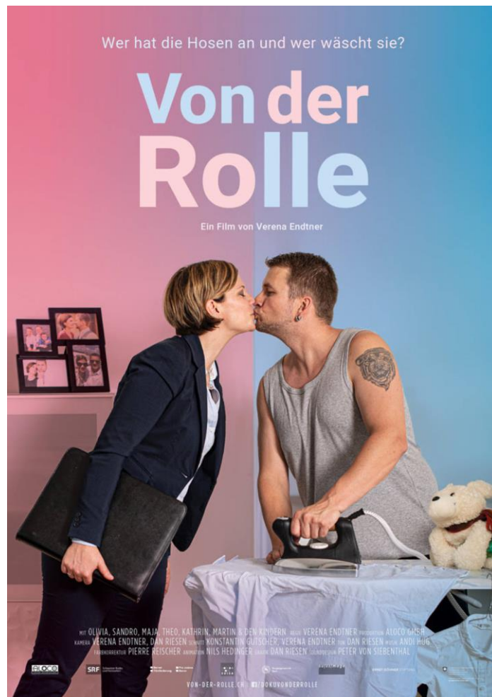
Filmpostcard – www.von-der-rolle.ch – 2019 – „Von der Rolle – Wer hat die Hosen an und wer wäscht sie?“