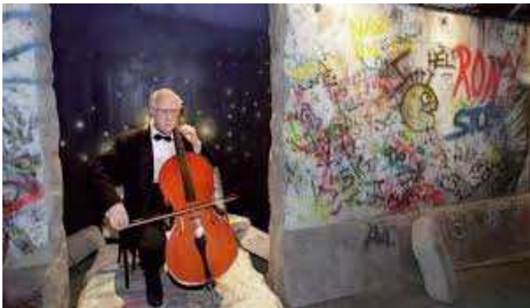
“Mauern sind nicht für ewig gebaut. In Berlin habe ich für mein Herz gespielt“, der Cellist Rostropowitsch am 11.November 1989.