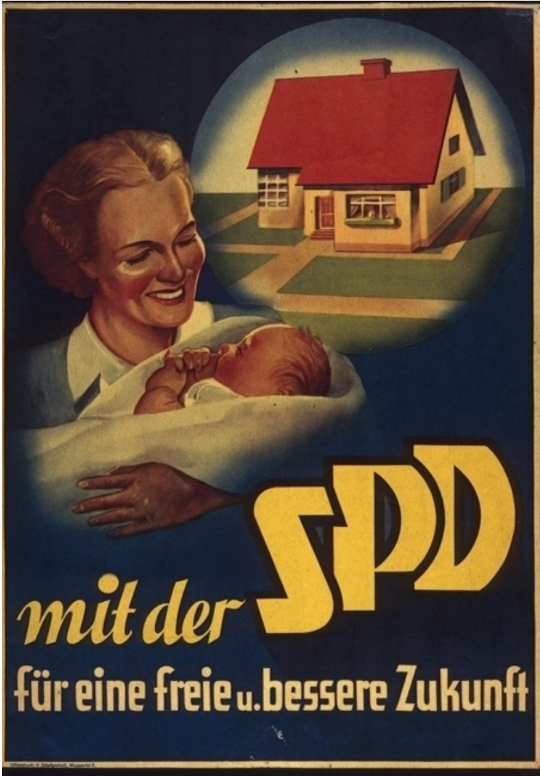
Die Frau in der BRD : Wahlplakat der SPD 1946

www.schule-bw.de, Bundesarchiv, Plak 005-011-005