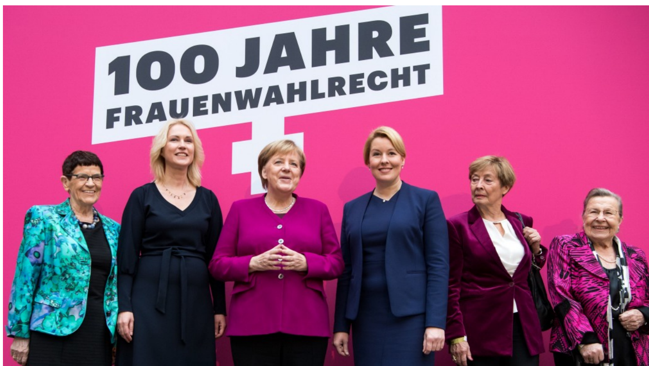
Angela Merkel feiert das Frauenwahlrecht, 2018