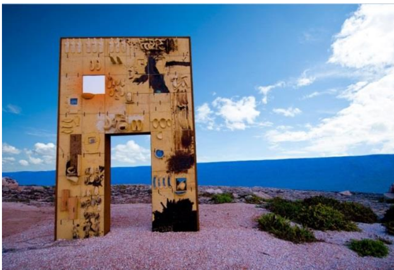
La Porta di Lampedusa

Secondo te, in quale misura un'opera d'arte come la Porta di Lampedusa può partecipare all'elaborazione e all'espressione della memoria?