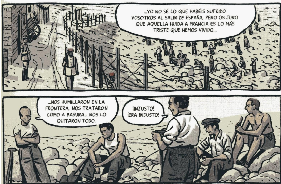
Paco Roca, La Nueve