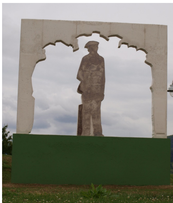
Andrés Montesanto, El inmigrante , 2014