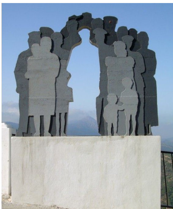
Andrés Montesanto, El emigrante , 2008