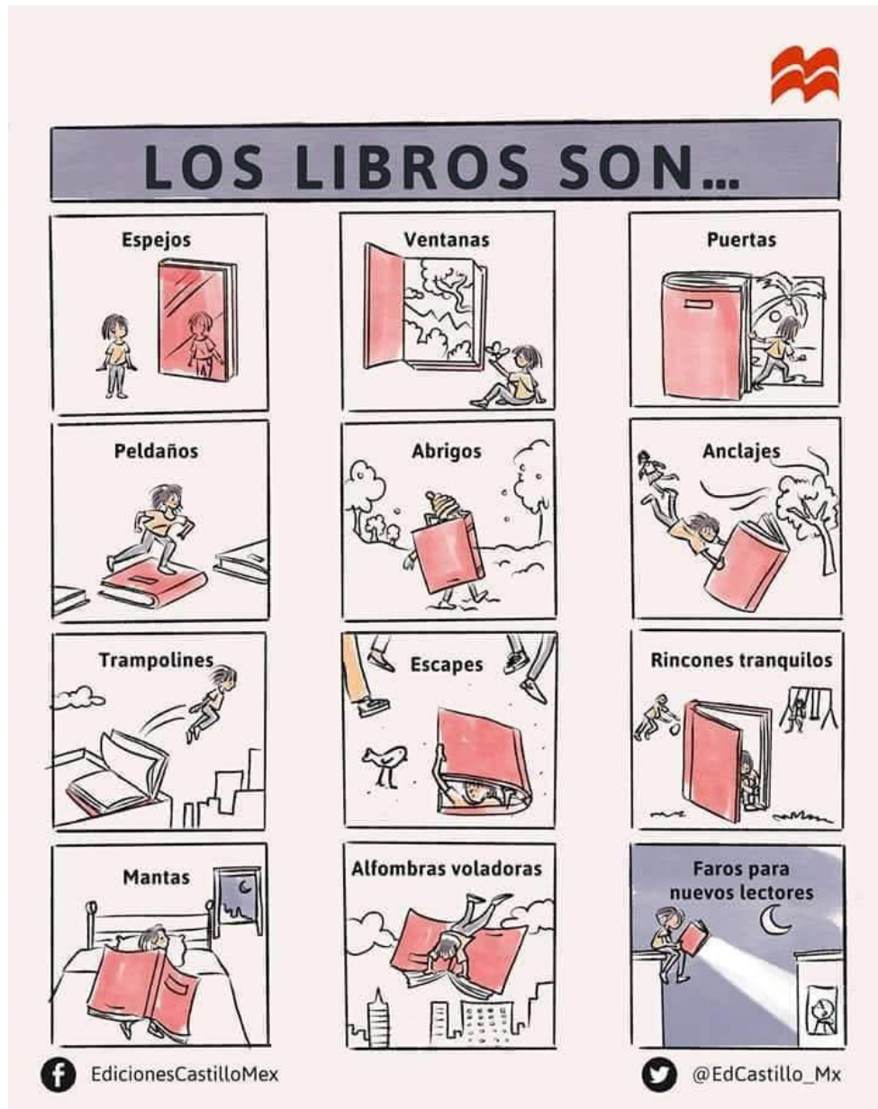
Cartel de las ediciones Castillo (México), 2018.