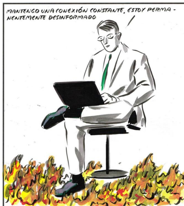
El Roto (caricaturista español), El País , 15/11/2018.