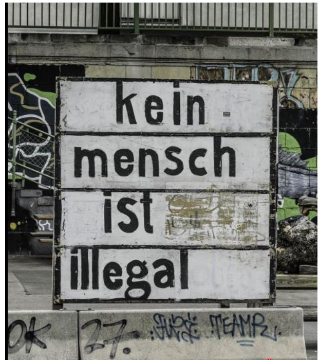
„Kein Mensch ist illegal“ Streetart-Logo für Antirassismus Berlin 2019