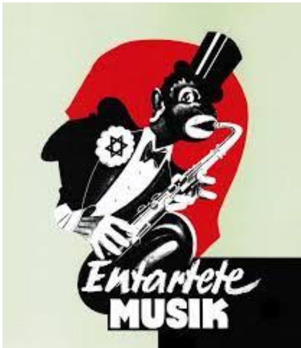
„Entartete Musik“ Plakat zur Ausstellung Düsseldorf 1938

„Am 4. Januar 1995 verlegte der Künstler ohne Genehmigung der Behörden die ersten Steine in Köln“. Muss Kunst immer legal sein? Wie stehen Sie dazu? Geben Sie konkrete Beispiele.