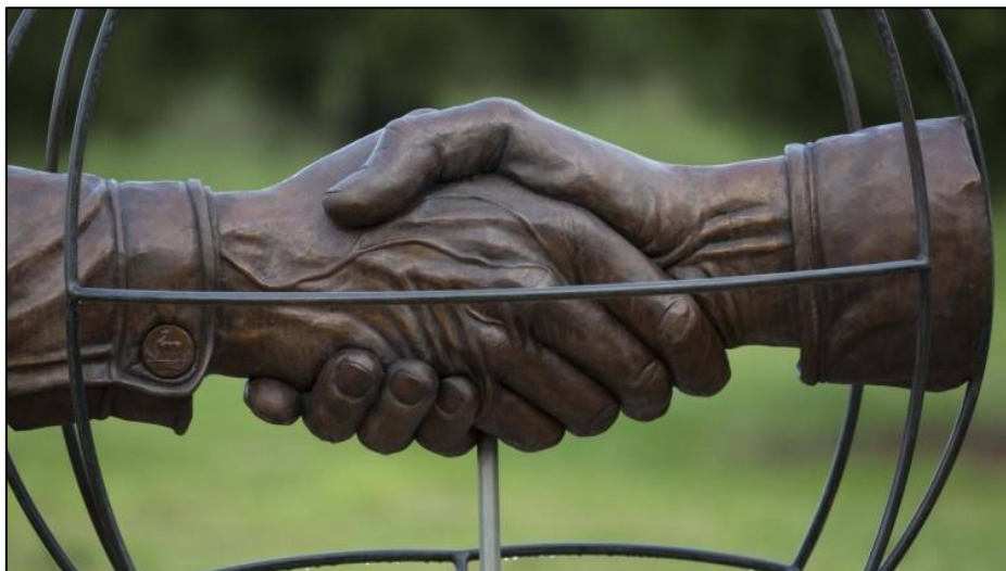
Denkmal in Erinnerung an den Weihnachtsfrieden 1914, Arras (Frankreich)

Die Gedenkstätte Berlin-Hohenschönhausen ist ein Ergebnis der friedlichen Revolution in Ostdeutschland 1989