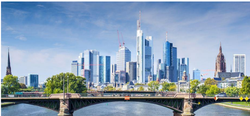
Skyline – Frankfurt am Main

Warum ist dieser Trend problematisch und was könnte man dagegen unternehmen? Argumentieren Sie und geben Sie konkrete Beispiele.