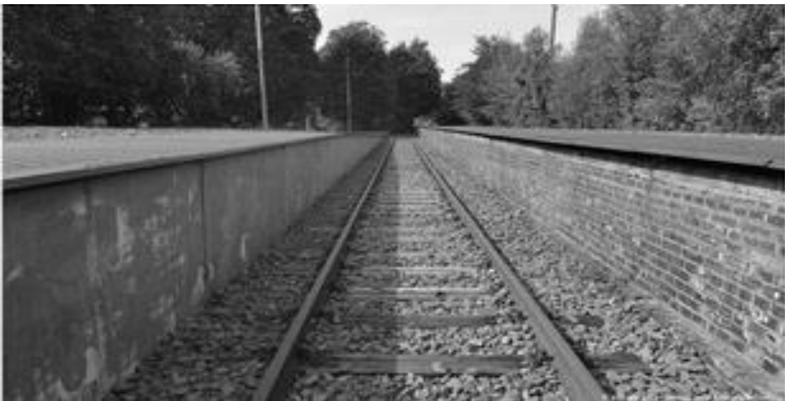
Ein beeindruckender Ort: Das Mahnmal Gleis 17 in Berlin Grunewald

10 Und Beynisch erinnert sich zudem an seine Besuche am Gedenkort Gleis 17 im S-Bahnhof Grunewald. Zehntausende Juden fuhren von hier aus mit der Bahn in den Tod. „Da spüre ich schon Traurigkeit. Diese Atmosphäre an diesem einen Gleis, die Pflanzen, die Stille.“