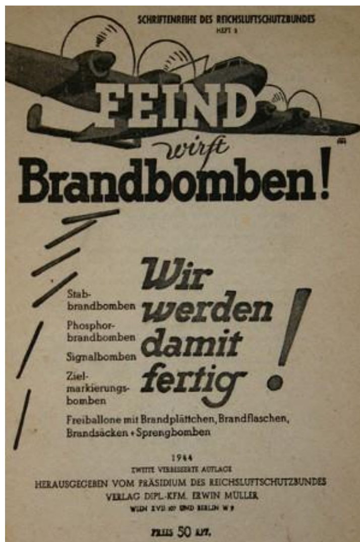
Wir werden damit fertig , Propaganda-Broschüre des Reichsluftschutzbundes, 1944