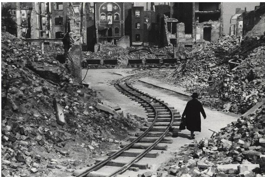
„Die Stunde Null“, Ritterstraße in Köln um 1947

Erklären Sie, warum es wichtig ist, dass wir uns heute noch an die Vergangenheit erinnern. Sie können sich dabei auf das Foto stützen.