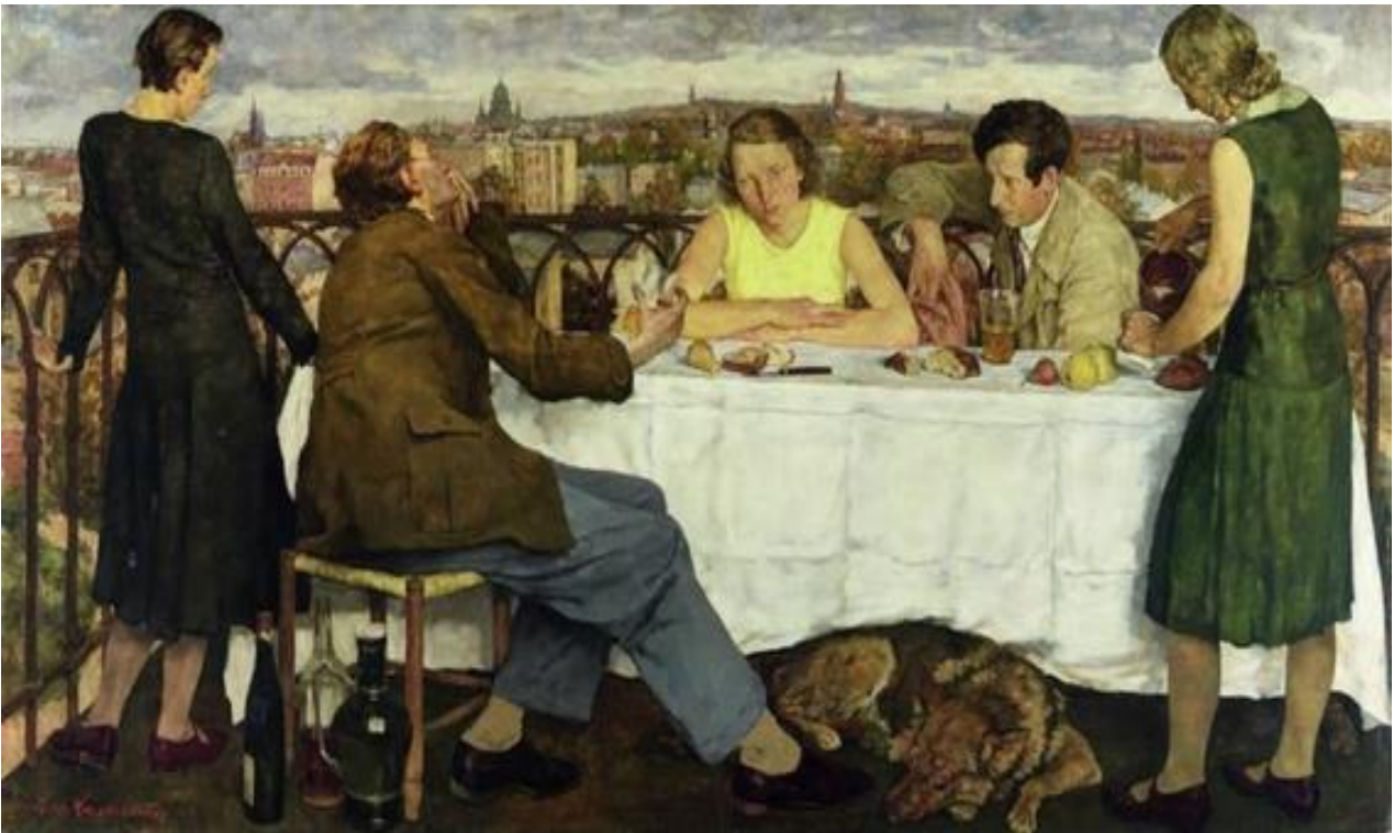
Lotte Laserstein, Abend über Potsdam , 1930. Nationalgalerie Berlin