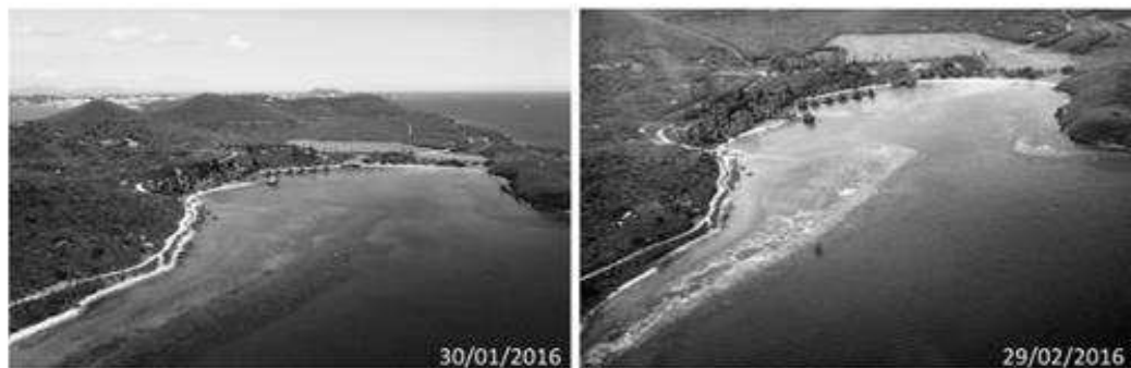
Figure 1 - Comparaison des deux vues aériennes de la baie du Kuendu Beach à Nouville, prises à la fin de janvier 2016 (à gauche) et à la fin de février 2016 (à droite) . Les tâches blanches visibles en 2016 correspondent au blanchissement massif des coraux.

En février 2016, la Nouvelle Calédonie a connu un épisode de blanchissement massif de ses récifs coralliens.