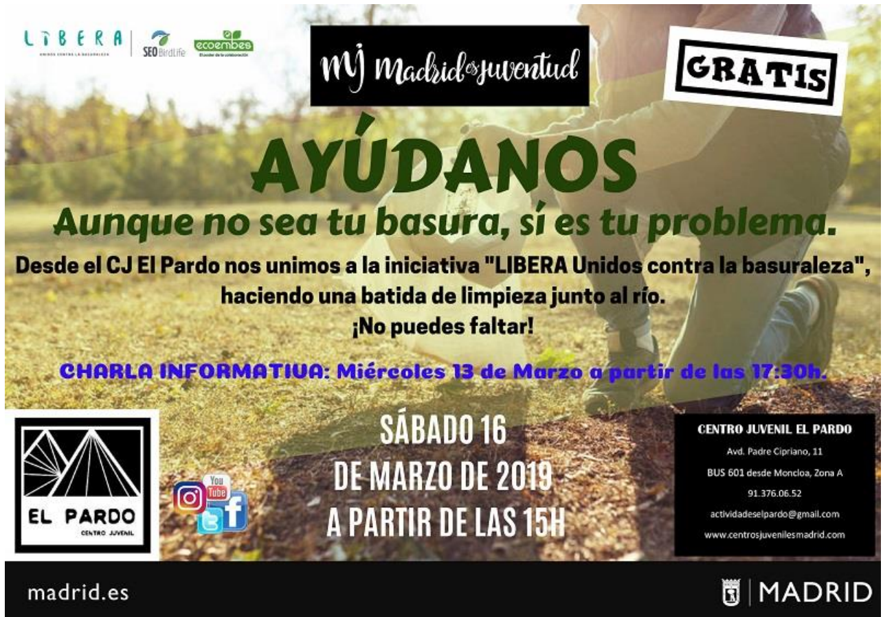
Campaña 'Madrid es Juventud', Ayuntamiento de Madrid, marzo de 2019.