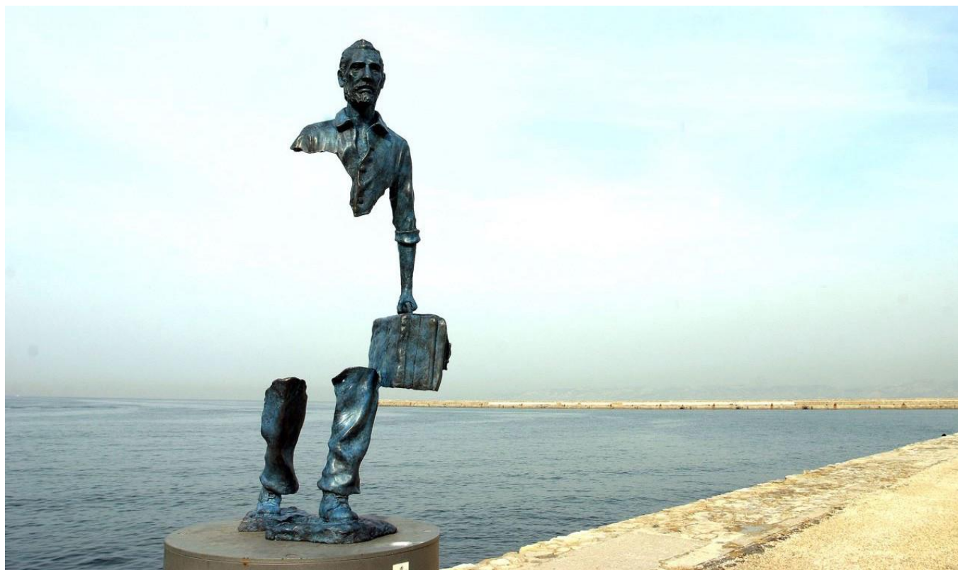
Bruno Catalano, Les voyageurs , scultura in bronzo, Marsiglia, 2013.

Bruno Catalano è un artista francese di origini siciliane, nato in Marocco nel 1960. "I Viaggiatori" sono una serie di sculture in bronzo che rappresentano migranti. Si innestano nel tessuto urbano e sono situate in varie città del mondo. Sono tutte accomunate da pose instabili, pesanti valigie e corpi svuotati, mancanti dal petto al bacino.