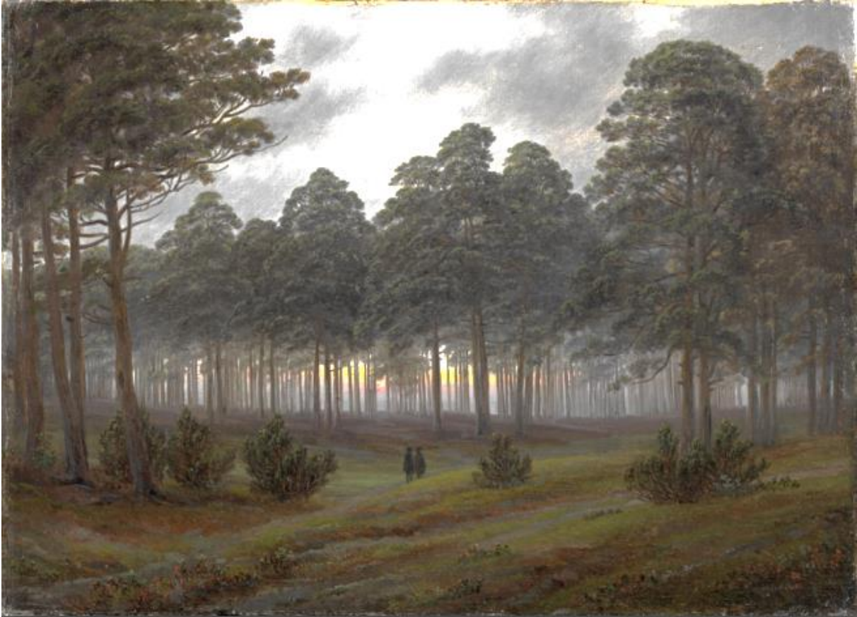
Caspar David Friedrich, Der Abend , 1821, 22cm x 30,5cm, Landesmuseum Hannover