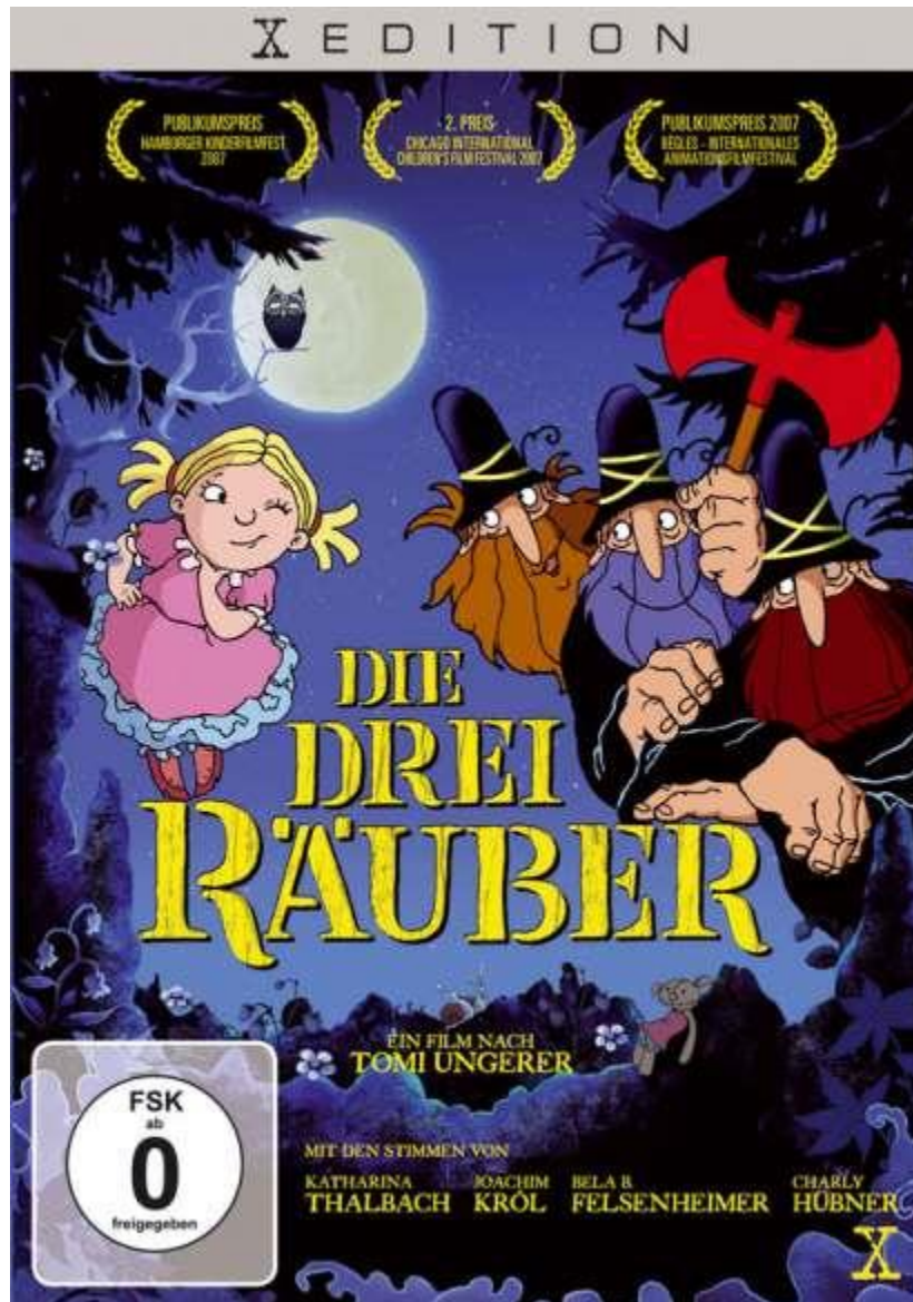
DVD Cover des Films, Die drei Räuber , Tomi Ungerer, 2017