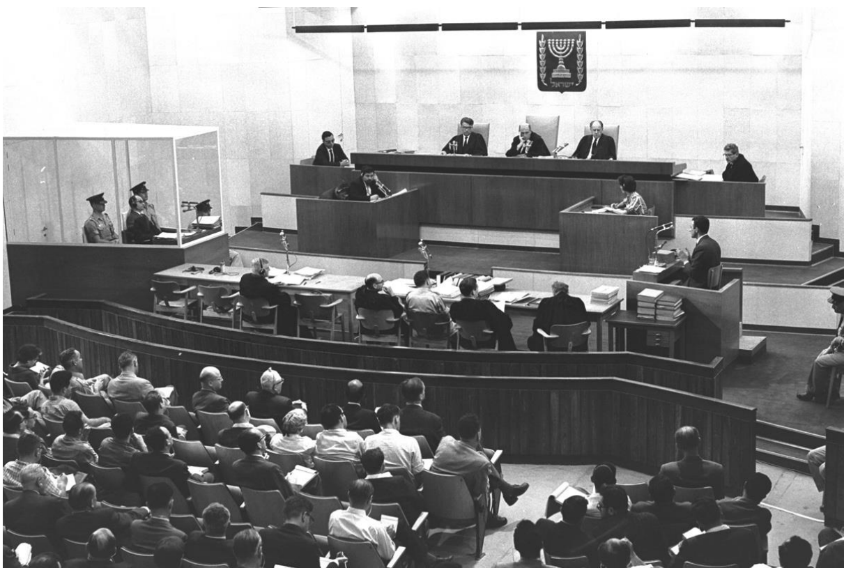
Salle d'audience du procès Eichmann le 13 décembre 1961.