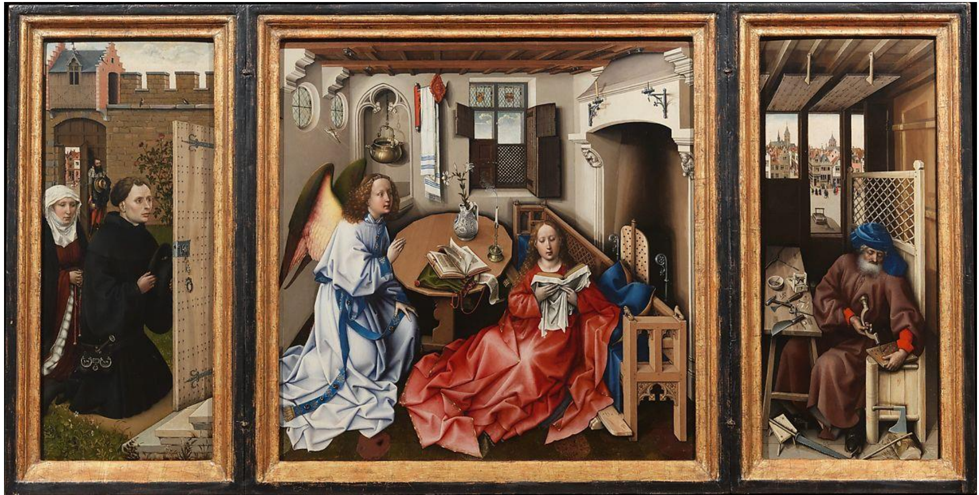
Robert CAMPIN, Triptyque de l'Annonciation (autel de Mérode), 1427-1432, huile sur panneau de chêne, 64,1 x 63,2 cm (panneau central), 64,5 x 27,3 cm (chaque panneau latéral). The Metropolitan Museum of Art, New York, États-Unis.