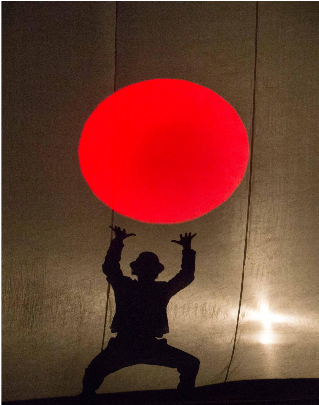
Cirque Plume, Tempus fugit ? Une ballade sur le chemin perdu , 2013, photographie Yves Petit, disponible en ligne : https://www.cirqueplume.com