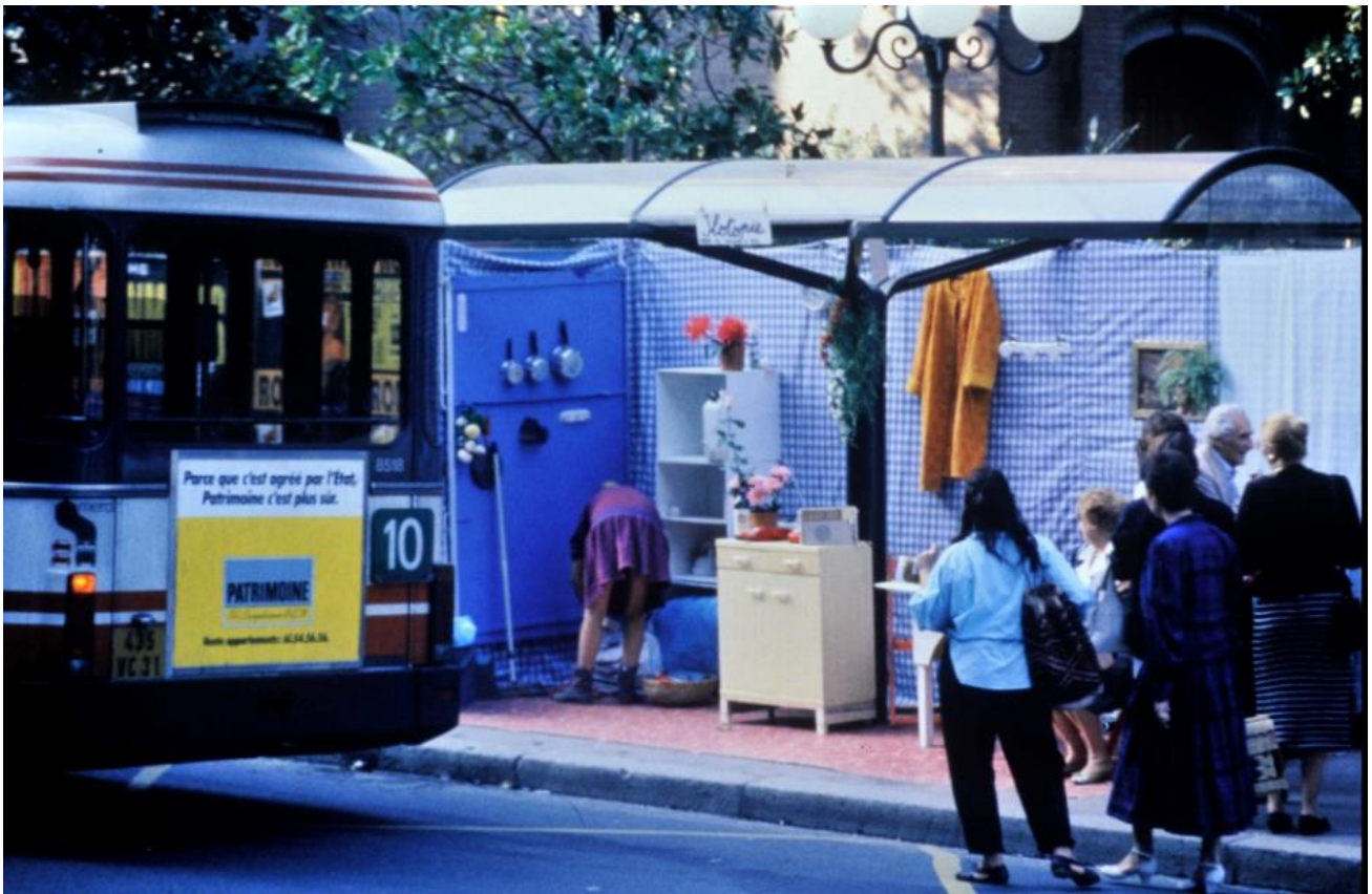
Compagnie Ilotopie, La Mise enabri-bus , festival de Scènes de rue de Toulouse, 1986, Joël Verhoustraeten, 1986, Encyclopédie des arts du cirque , BnF CNAC, BnF éditions multimédias, 2021.