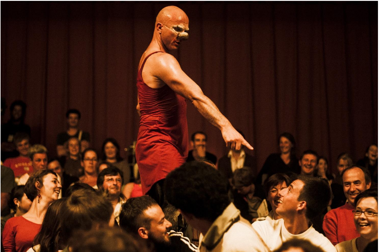
Ludor Citrik (Cédric Paga), Je ne suis pas un numéro , 2006, Philippe Laurençon, 2006, Encyclopédie des arts du cirque , BnF CNAC, BnF éditions multimédias, 2021.