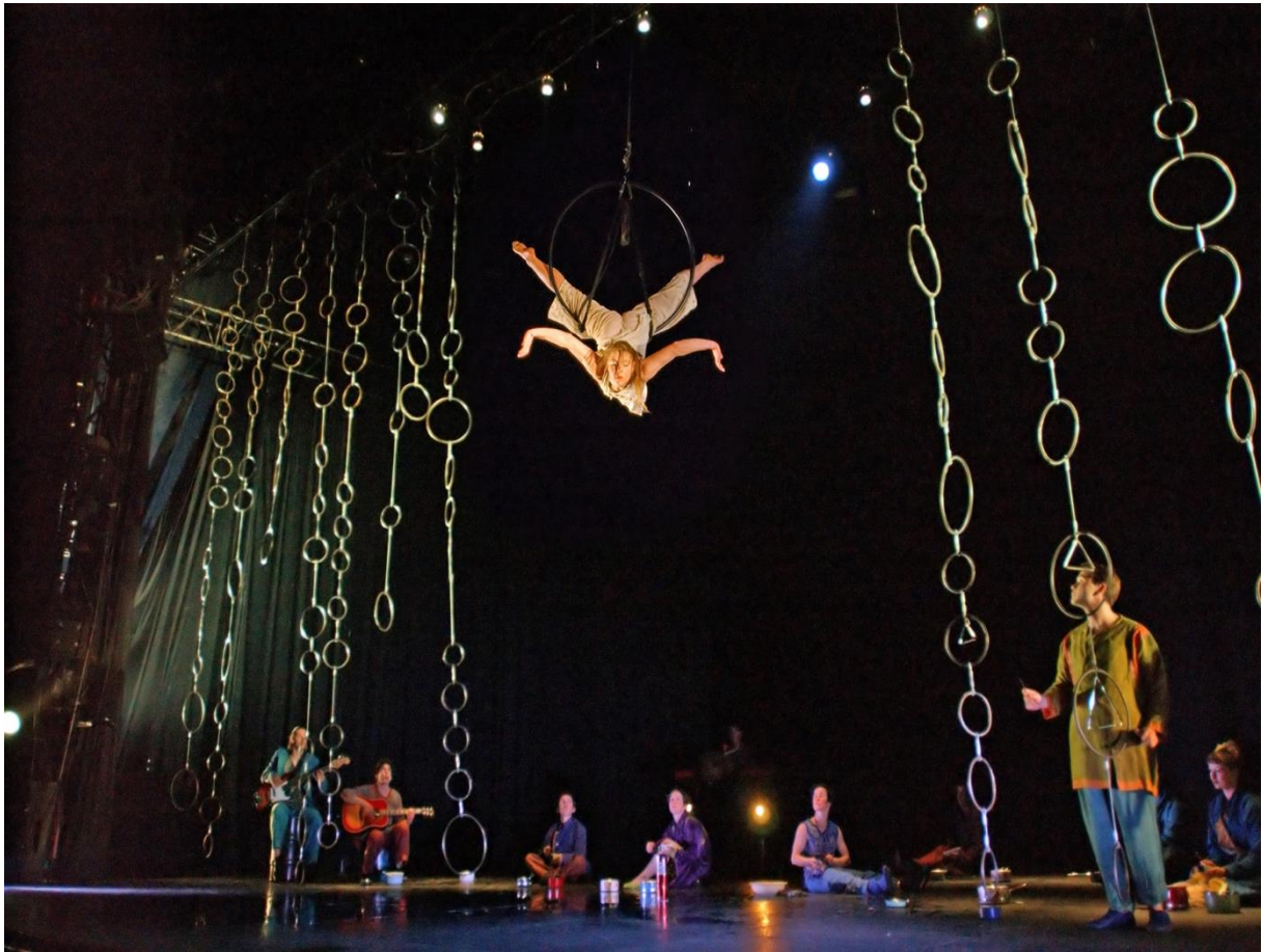
Cirque Plume, Plic Ploc , 2004, photographie Jacques Peeters, disponible en ligne : https://www.cirqueplume.com