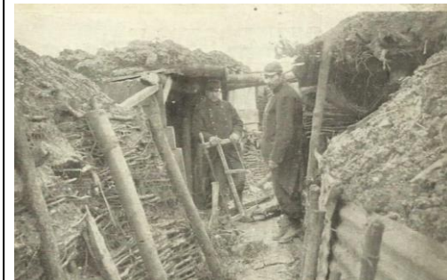
La Première Guerre mondiale