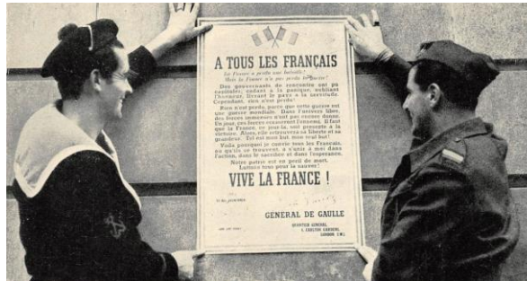
L'appel du Général de Gaulle