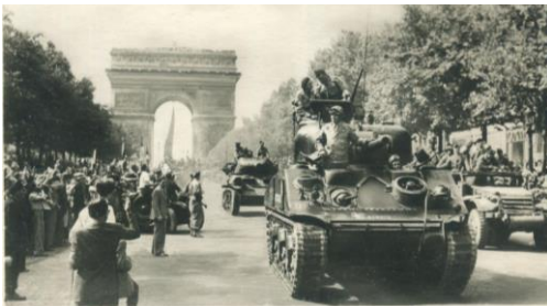
La Seconde Guerre mondiale