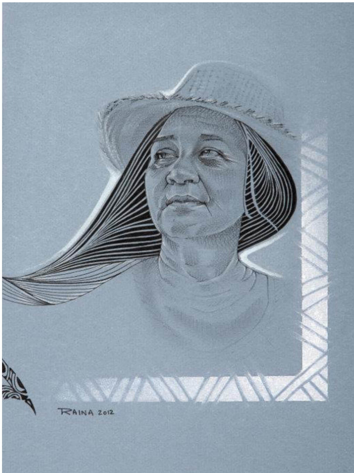
Raina CHAUSSOY, Portrait d'une mamie, 2012.