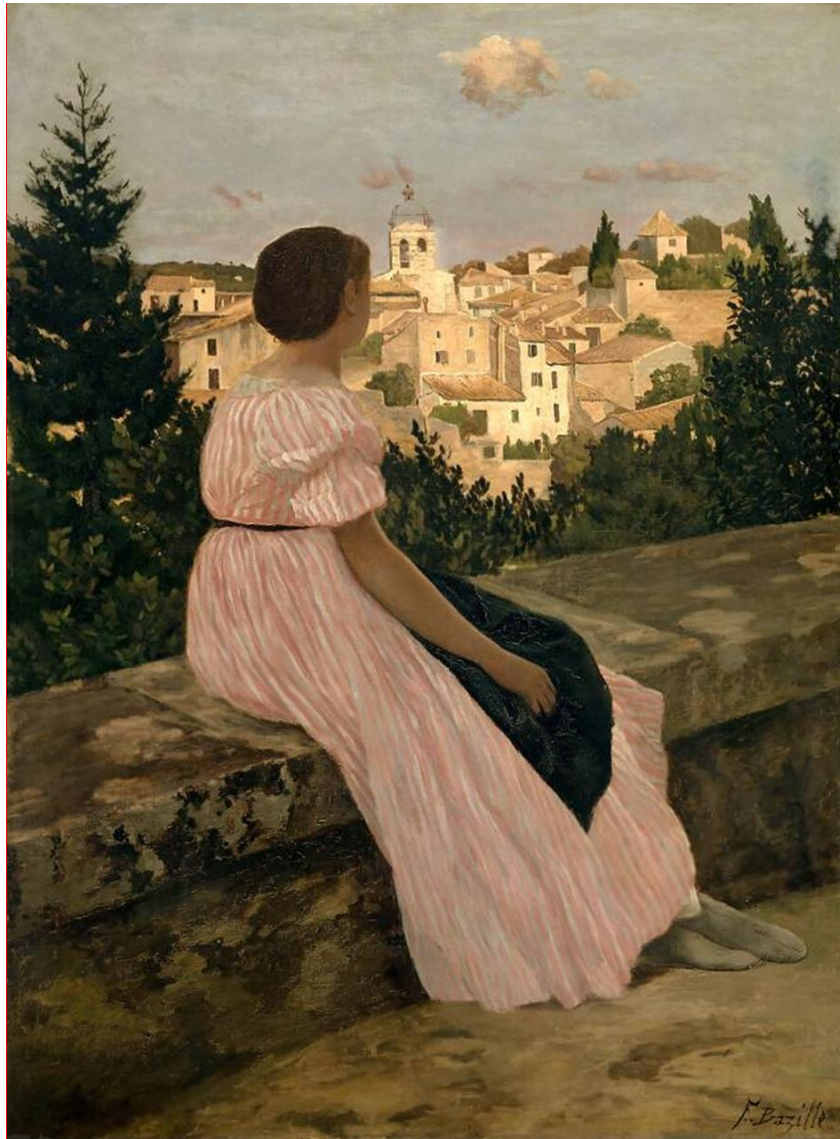
La Robe rose , Frédéric Bazille, 1864, Musée d'Orsay, Paris