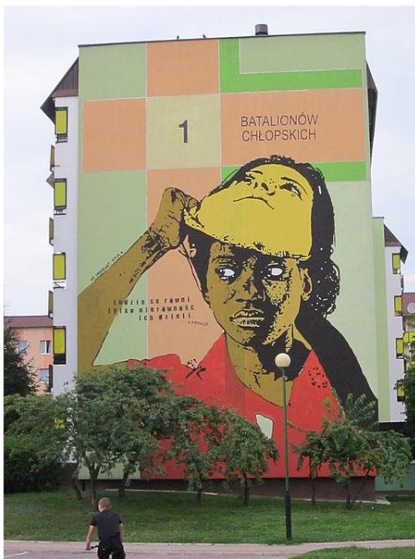
Mural antyrasistowski, "Ludzie są równi tylko nierówność ich dzieli" (cytat z Kazimierza Przerwy-Tetmajera), Białystok ul. Batalionów Chłopskich 1, autorzy: Anita Kitlas i Włoch Francesco Cherkos, 2013