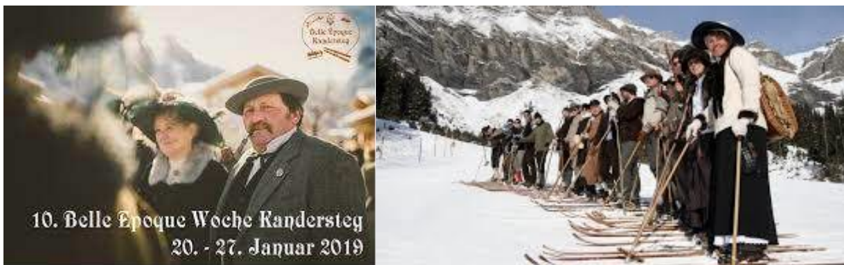
Nostalgiewoche in Kandersteg

Melanie Helmers – Presse und Sprache - Januar 2019