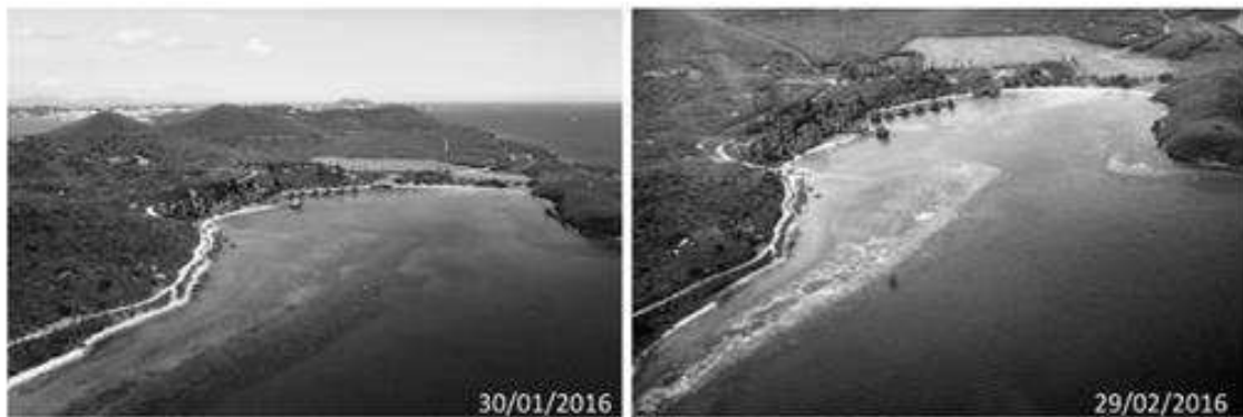
Figure 1 - Comparaison des deux vues aériennes de la baie du Kuendu Beach à Nouville, prises à la fin de janvier 2016 (à gauche) et à la fin de février 2016 (à droite) . Les tâches blanches visibles en 2016 correspondent au blanchissement massif des coraux.

En février 2016, la Nouvelle Calédonie a connu un épisode de blanchissement massif de ses récifs coralliens.