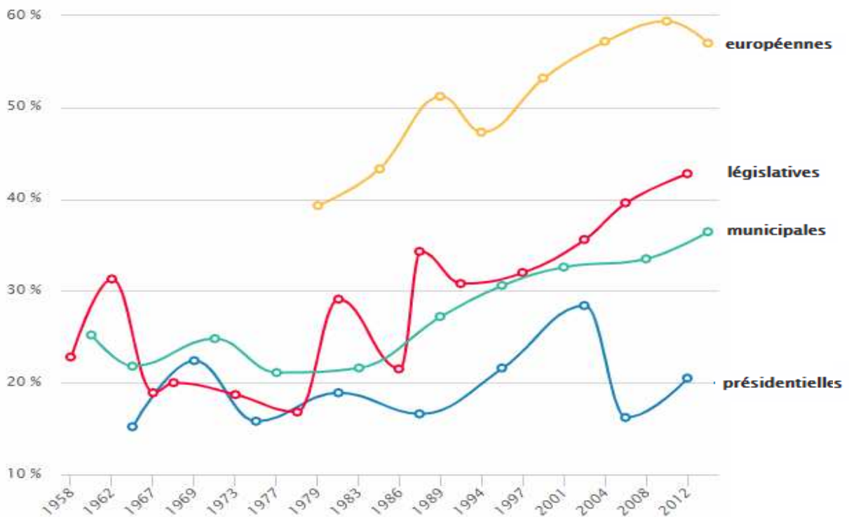
Document 1 : Les taux d'abstention au premier tour des élections présidentielles, municipales et européennes en France de 1958 à 2014, en pourcentage des électeurs inscrits